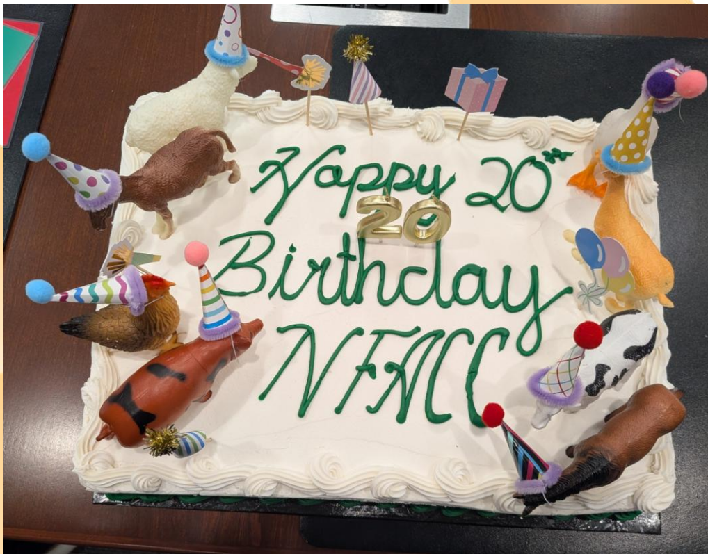
Le CNSAE a célébré ses 20 ans avec un gâteau d'anniversaire!